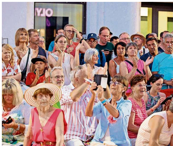
Beste Stimmung in und rund um die Anlage.