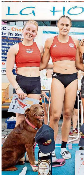
Auch Hündin Ella freute sich.